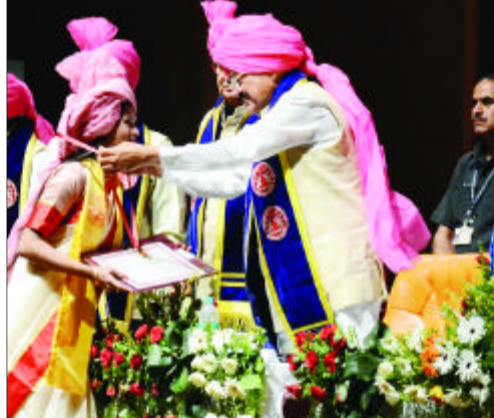
मुख्यमंत्री, शिक्षा मंत्री, कृषि मंत्री, पंचायत मंत्री, सांसद हुए शामिल

रायपुर, 16 मई (हाईवे चैनल)। कुशाभाऊ ठाकरे पत्रकारिता एवं जनसंचार विवि के पी. दीनदयाल उपाध्याय ऑडिटोरियम में आयोजित तृतीय दीक्षांत समारोह में देश के उप राष्ट्रपति एम. वेंकैया नायडु ने कहा कि आज भी हमारे देश की अनुसूचित जातियों, जनजातियों, महिलाओं और पिछड़े वर्गों के करोड़ों लोगों तक सूचनाएं सही मायने में व संदर्भ में तथा सही समय में पहुंचाने आवश्यकता है। इस महती कार्य को सफलता पूर्वक करके एक समरस समाज की स्थापना में योगदान दिया जा सकता है। उन्होंने बताया कि हाल के वर्षों में देखा गया है कि समाचार माध्यम ना सिर्फ सूचना प्रेषित कर रहे हैं बल्कि एजेंडा तैयार करने में महत्वपूर्ण भूमिका निभा रहे हैं। लोकतंत्र के तीनों स्तंभों के साथ ही नागरिकों के समक्ष एजेंडा प्रस्तुत कर रहे हैं। उपराष्ट्रपति ने बताया कि सभी भलीभांति जानते हैं कि समाचार पत्रों का प्रकाशन एक मिशन से बदलकर उद्योग का रूप ले चुका है जो दुर्भाग्यपूर्ण है।