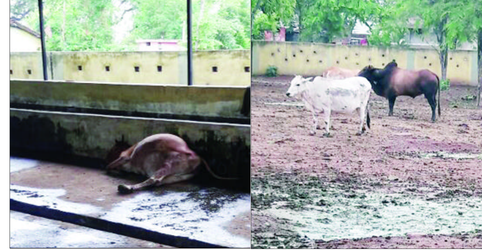
नगर पालिक निगम की अनदेखी के चलते अफरा-तफरी

हाईवे चैनल रायपुर, 12 जुलाई। नगर में एक से अधिक स्थानों पर नगर पालिक निगम द्वारा संचालित कांजी हाऊस में दुर्दशा का आलम दिखलाई पड़ रहा है। यहां पर प्रतिदिन विभिन्न स्थानों से लाई जाने वाली गौमाता की स्थिति चिंतनीय है। एक ओर लाखों रुपये चालान के रूप में गौ मातिकों से वसूल किये जाते हैं। वहीं दूसरी तरफ शुल्क के एवज में गौ माताओं को कोई व्यवस्था नहीं दी जाती। इसी के चलते हालत काफी दयनीय है। यहां तक कि इन कांजी हाऊस से दुधारू गौमाताओं की अफरा-तफरी होने की जानकारी सामने निकल कर आ रही है। बताया गया है कि रायपुर जिले के लाखेनगर, अटारी, रायपुरा, भाटागांव इत्यादि स्थान पर कांजी हाऊस चल रहे हैं। जहां प्रतिदिन सड़क पर आवारा घूमने वाले मवेशियों को पकड़कर निरूद्ध किया जाता है। हर दिन 100 से 500 मवेशियों को अलग-अलग श्रेणियों में ले जाकर निरूद्ध किया जाता है। जहां व्यवस्था नहीं होने के कारण भूख प्यास से मवेशियों कि मौतें तक हो रही हैं। अकाल मौत के शिकार बनने वाले मवेशियों के मांस का भी विक्रय किये जाने की सूचना एक अपुष्ट सूत्र ने दी है। ऐसे में यह सवाल साफ तौर पर उठ रहे हैं कि कांजी हाऊस के संचालन में रखे जाने वाले मवेशियों के साथ दुर्दशा पूर्ण व्यवहार क्यों। जबकि गौ शालाएं चल रही हैं। यहां तक कि निगम ने अब मवेशियों के मौत होने पर सुरक्षित गौ वंश संचालकों को सौंपे जाने की व्यवस्था की है। वहीं कांजी हाऊस से होने वाली अनियमितताएं गौ मालिकों को भारी पड़ रही है। लिहाजा मालिकों ने सवाल उठाने शुरू कर दिये हैं। पिछले दिनों हाईवे संवाददाता ने शहर के संचालित कांजी हाऊस- अटारी का निरीक्षण किया। जहां पर हर तरफ अव्यवस्था का आलम था। मवेशियों के