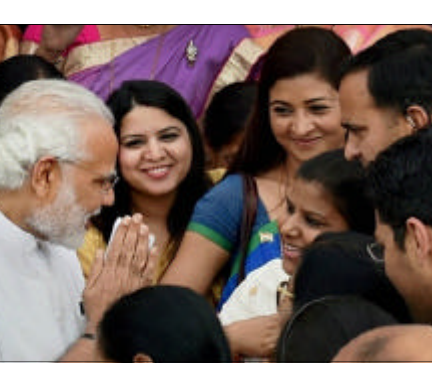
मोदी ने स्व-सहायता समूहों से किया संवाद

संवाद के दौरान पीएम ने कहा कि महिला सशक्तीकरण हमारी सरकार की प्रतिबद्धता है और इसका उदाहरण है कि हमारी सरकार बनने से पहले 2011 से 2014 के बीच पांच लाख स्वयं सहायता समूह बने और सिर्फ 50 से 52 लाख परिवार इससे जुड़े थे। जबकि हमारी सरकार बनने के बाद 2014 से 2018 के बीच 20 लाख स्वयं सहायता समूह बने। इस प्रकार इनकी संख्या में चार गुणा वृद्धि दर्ज की गई और पहले की तुलना में चार गुणा अधिक परिवार इससे जुड़े। उन्होंने कहा कि उनका सौभाग्य है कि आज देशभर की एक करोड़ से ज्यादा महिलाओं से संवाद करने का अवसर मिला है जो अपने आप में संकल्प, उद्यमशीलता और सामूहिक प्रयासों का एक प्रेरणादायी उदाहरण है। मोदी ने कहा कि हिन्दुस्तान की गरीब महिलाएं दुनिया के विश्वविद्यालयों की टीम