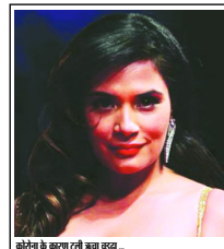
कोरोना के कारण ली ब्रेक वल...

वर्ष - 22 अंक-161, जगदलपुर, मंगलवार, 24 मार्च 2020 पृष्ठ- 8, मूल्य- ₹ 2.00 • जगदलपुर • रायपुर • बिलासपुर से प्रकाशित