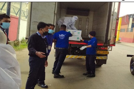
पटना, जयपुर और लखनऊ भी भेजी गई है। अधिकारी ने जानकारी दी कि आज कुल 14 कंसाइनमेंट भेजे जाएंगे। स्वास्थ्य मंत्रालय के अनुसार, कोवैक्सीन की 55 लाख और कोविशील्ड की 1.1 करोड़ आपातकालीन इस्तेमाल के लिए मंजूरी दी जा चुकी है।