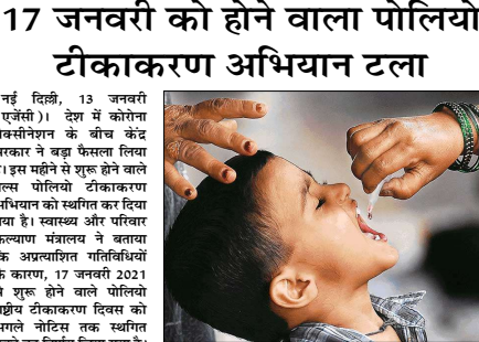
सूझा बल के जवानों को गया है। देश में बड़े स्तर पर शुरू हो रहे टीकाकरण अभियान के तहत सबसे पहले फेड लाइन वर्कर्स को कोरोना की देखरेख शुरू किया गया है। वना में कि पिछले 25 साल में अब पहला मौका है जब

छत्तीसगढ़ में अब तक बड़ पलू की पुष्टि नहीं