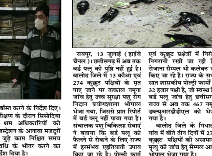
रायपुर, 13 जनवरी (हाईवे चैनल)। छत्तीसगढ़ में अब तक बड़ पलू की पुष्टि नहीं हुई है। बालोद जिले में 13 कोआए 274 कृषक पक्षियों के मृत पाए जाने पर तत्काल न्युना जांच शुरू की जा रही है। जांच के दौरान उच्च सुरक्षा पोषण निदान प्रयोगशाला भेषुण भेजा गया, जिससे प्राप्त रिपोर्ट में बड़ पलू नहीं पाया गया है। संचालक पत्रु विज्ञानिया सेवारत गांव में कीले लीन दिनों में 274 कैलरों से रोकने के लिए राज्य में हराबरा एप्रिटीवाली उपाय किए जा रहे हैं। विलेदी कांस

छत्तीसगढ़ में अब तक बड़ पलू की पुष्टि नहीं