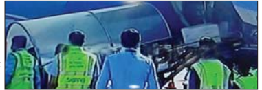
3.23 लाख टीका पहुंचा प्रदेश

रायपुर, 13 जनवरी (हाईवे चैनल)। केंद्र सरकार ने छत्तीसगढ़ को पहली खेप में 3.23 लाख कोवैडिओवैक्सीन की है। आज सीएम इंद्रीयुट पुणे में बनी वैक्सीन फ्लाइट से रायपुर माना एयरपोर्ट पहुंच गई है। यहाँ से स्वास्थ्य विभाग से मिली जानकारी के मुताबिक राज्य के स्वास्थ्य क्षेत्र से जुड़े कामिनों और फ्रंट लाइन वर्कर्स के लिए कोरोना वैक्सीन भेजे जा रहे हैं। प्रोटोकॉल के अनुसार प्रदेश के सभी जिलों में इन टीकों के वितरण, परिवहन एवं भंडारण की पुष्टा व्यवस्था की गई है। जिलों में मांकाइत और आपात स्थिति से निपटने की पूर्वाभ्यास भी किया जा चुका है। छत्तीसगढ़ को भारत सरकार द्वारा पहली खेप में सीएम इंद्रीयुट