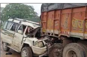
1 की हालत गंभीर

रायपुर/कांकेर, 13 जनवरी (हाईवे चैनल)। नेशनल हाइवे-30 में दर्दनाक हादसा हुआ है। तुरक 4 बच्चे आसपास एक तेज रफतार पिकअप वाहन खड़े