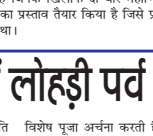
विवेश पूजा अर्चना करती हैं और उपवास रखे जाते हैं इसके अलावा पंचांग हरियाणा राज्यों में खास तौर पर नई

नई दिल्ली, 13 जनवरी (एजेंसी)। कैपिटल बिल्डिंग (अमेरिकी संसद भवन) पर पिछले सप्ताह हुए हिंसक हमले के मद्देनजर अमेरिकी के निवर्तमान राष्ट्रपति डोनाल्ड ट्रंप के खिलाफ महाभियोग प्रस्ताव पर डेमोक्रेटिक नेताओं के नियंत्रण वाली अमेरिकी प्रतिनिधि सभा बुधवार को मतदान करने के लिए तैयार है। महाभियोग प्रस्ताव पर मतदान के साथ ही ट्रंप अमेरिकी के इतिहास में पहले ऐसे राष्ट्रपति बन सकते हैं जिनके खिलाफ दो बार महाभियोग चलाया गया। संसदों जैनी रिकन्स, डेविड सिस्सिलिनो और टेड लीवू ने महाभियोग का प्रस्ताव तैयार किया है जिसे प्रतिनिधि सभा के 211 सदस्यों ने संस-प्रायोजित किया। इसे सोमवार को पेश किया गया था।